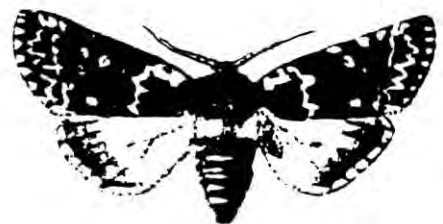
PARMELINA RIDENS F. EKGULHORNSPINNARE