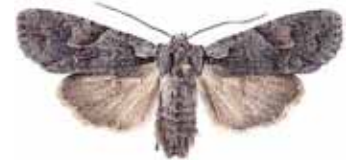
Lithophane furcifera Gaffeltecknat träfly