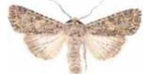
Dicentra trifolii Klöverfly