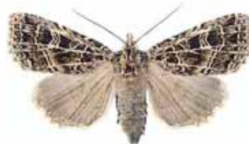
Naenia typica Gråribbat kvällsfly