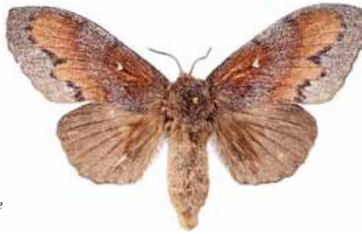
Dendrolimus pini Tallspinnare (hona)