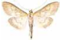
Microstega pandalis Spensligt ängsmott