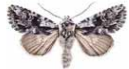
Actinotia hyperici Grått