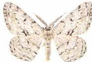
Boarmia roboraria Stor eklavmätare