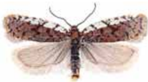
Acleris fimbriana Odonvärvecklare