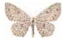
Cyclophora pendularia Pilgördelmätare