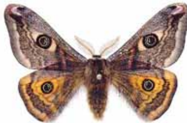
Sauria pavonia Påfågelspinnare