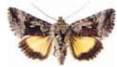
Synographa microgamma Torvmossemetalfly