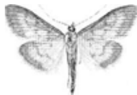
Bild 5: Microstega pandalis

1686 - Anania verbascalis : 1 ex 6/9 Björkbacken, Västerljung (LGÖS, EQTS). Ny för området och nytt landskapsfynd . Ett överraskande fynd av en art som fram till för 2 år sedan var en mycket sällsynt gäst i sydligaste Skåne. Arten har under 2002 och 2003 expanderat och har nu anträffats i flera landskap norr om Skåne såsom ÖI, Sm och nu även Sdm.