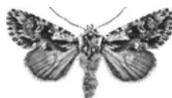
Bild 12: Actinotia hyperici: Grått johannesörtfly

2646 - Actinotia hyperici : 6-8 ex larver noterades på Tjuvholmarna 2002. Ett ex kläcktes 5/8 2002. Övriga övervintrade. 2 ex kläcktes överraskande så sent som augusti 2003 inga exemplar kläcktes till vår försommar generationen (LJRS).