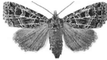
Bild 13: Naenia typica: Gråribbat kvällsfly Västerljung Sdm ExL aug 1999 (EQTS)

2706 Naenia typica : En hona insamlad 5/8 2002 togs på ägg. Hon lade 7 ägg. Larverna föddes upp på al men växte mycket långsamt. I fjärde stadiet i mitten av september gick de in i diapaus för vintern (LJRS). Samtliga larver dog under övervintringen.