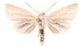
Sedina buettneri Brunstarrfly