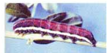
Larv Grått johannesörtsfly