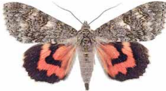
Catocala nupta Vinkelbandat ordensfly