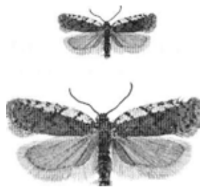
Bild 14: Acleris fimbriana: Odonvårvecklare Studsvik Sdm 13/9 2002 (EQTS)

En av de nya arterna för området år 2002 var (Odonvårvecklare) Acleris fimbriana . Nya fynd av arten inom området har inte gjorts i år, fyndlokalen har ej heller besökts i detta syfte. Här redovisas förra årets exemplar i bild, dels i naturlig storlek och dels i 100 procents förstoring.