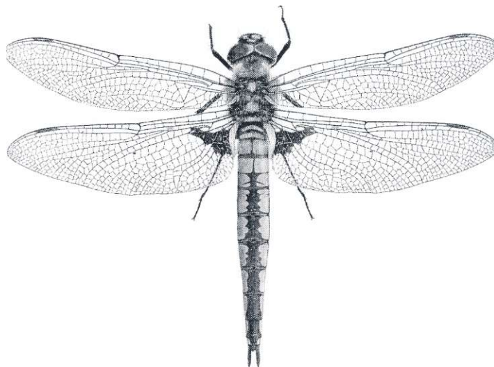
Tvåfläckad trollslända: Epilheca bimaculata