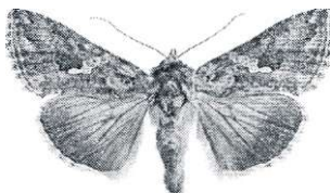
Thricoplusia ni (Nifly): Hona från 5/6 Spåtorp, Vagnhärad (LJRS)

Årets mest intressanta och överraskande fynd var den fräscha honan av flyet Thricoplusia ni (Nifly) som hävdades på tjärblomster utanför Vagnhärad i början av juni. Detta var det tredje fyndet i Sverige, ett nytt landskapsfynd för Södermanland och en ny art för området. Ett annat överraskande fynd var en hane av den normalt lite sydligare arten Agriopis marginaria (Grågul frostmätare) som dök upp vid ljusfällan i Trosa redan i slutet av mars. Detta är ett nytt fynd för området men arten har tidigare noterats i Södernanland. Kanske är den bofast i trakten men sällsynt. Eftersom honan är vinglös så har den nog svårt att sprida sig långa sträckor åt gången.