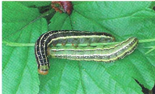
Xylena vetusta (Mindre mantelfly): Larver ex ovo från hona 2/5 Trosa (LJRS)

2535 - Miniotvpe adusta : 1 ex 22/6 Trosa (LJRS).