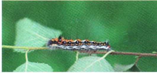
Acronicta tridens (Treuddtecknat aftonfly): larv i sista stadiet.

2381 - Acronicta tridens : 2 ex larver på björk slutet aug Frillingsmossen, (HGNS, LGOS).