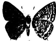
L. boeticus LÅNGSVANSAD BLÅVINGE

L. populi ännu ett bra år, obsades på flera ställen i juli.