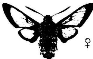
H. fuciformis HUMLELIK DAGSVÄRMARE

H. convolvuli 5 ex obsade på Jogersö, Oxelösund i mitten av september ett ex insamlat i Sättersta för äggläggning. De fåtal ägg som lades kläcktes dessvärre inte.