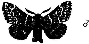
S. lunigera FJÄLLSPINNARE

S. lunigera flera ex 9/8 Stigtomtamalmen bla ett ex av den helsvarta formen. Den säkraste lokalen i området.