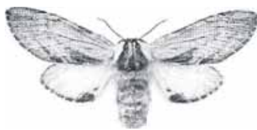
Hoplitis inii Trollspinnare