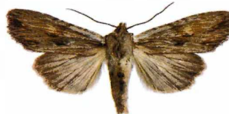
Litophane socia Gråbrunt träfly