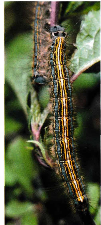
Larv av Malacasoma neustria Hedringsspinnare

2708 - Pyrrhia umbra : 1 ex 10/7 Trosa, (LJRS).