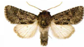
Luperina testacea Gräsrotfly

2360 - Autographa buraetica 1 ex 8/7 Trosa. Relativt ovanlig i området. (LJRS).