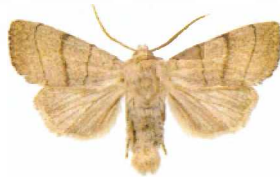
Charanyca trigrammica Streckfly