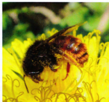
Fig. 1 Snäckmurarbi.

Det är ett mycket vackert litet bi! Hon är ungefär en centimeter lång, vackert färgad i svart och rödbrunt, söta antenner och kolsvarta glänsande droppformade ögon. Sina föräldrar får de aldrig träffa, aldrig se sina barn, det är murarbinas öde. De föds alltid föräldralösa året efter, då "mamma bi" varit död sedan länge.