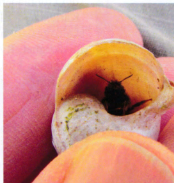
Fig. 3 Tom vinbergssnäcka med framkikande bi.