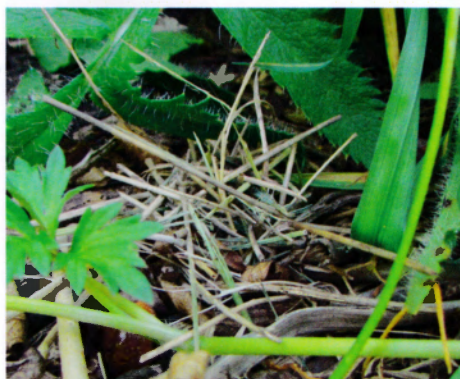
Fig. 5 och 6 Ett tält av torra strån döljer en snäcka med bokammare. Under tältet fanns denna gula trädgårdssnäcka som jag försiktigt tog fram, och lika varsamt satte tillbaka igen. Man skimtar den yttersta skiljeväggen av tuggade gröna blad.