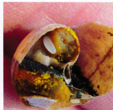
Fig. 4 Den trasiga snäckan med två bokammare i. Ett av äggen syns.