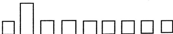
Figur ur Gullander: "Svärmare och spinnare"

Observerade exemplar antal och datum totalt 10 ex 24/8 25/8 26/8 27/8 28/8 29/8 2/9 3/9 4/9