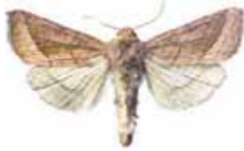
Cucullia lucifuga Ljusskyggt kapuschongfly