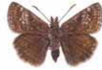
Erynnis tages Skogsvisslare