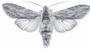
Cucullia lucifuga (Ljusskyggt kapuschongfly)

2501 - Cucullia umbratica : 1 sent ex 24/8 Trosa (LJRS).