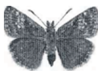
Erynnis tages (Skogsvisslare)

1714- Erynnis tages : 6 ex 11/6 noterades inom ett litet område vid Grindstugan Tullgarn. Dessutom 1 ex 11/6 Frillingsmossen, (LJRS).