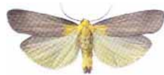
Lithosia quadra kungslavspinnare