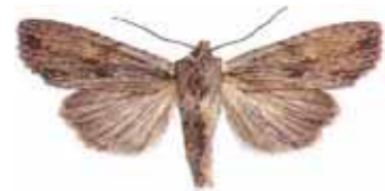
Litophane socia Gråbrunt träfly