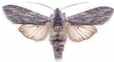
Cucullia lucifuga Ljusskyggt kapuschongfly