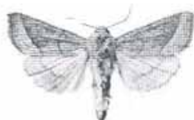
Hydraecia ultima (Förväxlat stamfly)

2458 - Hydraecia ultima : 1 ex 14/8 (hona) Trosa. Andra fyndet inom området, trolig migrant. Tredje fyndet i Södermanland. Nytt tomt fynd (LJRS).