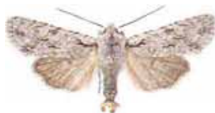
Litophane ornitophus Vitgrått träfly