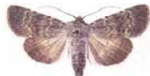
Standfussiana lucernea Ljusjordfly