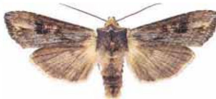
Xylota vetusta Mindre mantelfly