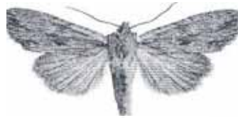
Litophane socia (Gråbrunt träfly)

2522 - Litophane socia : 1 ex 25/4 samt 1 ex 3/5 Trosa . det senare en hona som togs på ägg. Honan lade brunbeiga ägg ca 20-25st den 5-6/5. Äggen lades ett och ett eller enstaka i par. Larverna kläcktes i slutet av maj efter ca 14 dagars tid som ägg. Larverna var i mitten av juni knappt 2 cm. Den 19/6 var larverna 3 cm gröna och smala med vit rygglinje. I början av juli kröp de ned till förpuppning. Larverna åt diverse lövträd men helst sälg. Fjärilarna kläcktes 24/8 - 28/8, (LJRS)