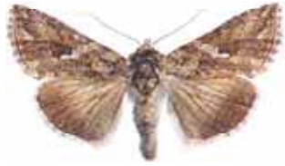
Thricoplusia ni Ni fly