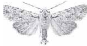
Litophane ornitophus (Vitgrått träfly)

2523 - Litophane omitophus : 1 ex 2/5 Trosa, togs på ägg. Honan lade gula runda ägg ca 40 st i stora hopar, klumpar 5/5. Äggen ändrade targ 7/5 och blev bruna. Äggen kläcktes efter ca 10 dagar. Larverna var efter kläckning gröna med vita små prickar. I mitten av juni var larverna ca 2 cm. Den 19/6 var larverna 3-4 cm långa gröna med vit pudring utan speciella kännetecken. Larverna kröp ned till förpuppning i början av juli. Larverna åt endast ek. Fjärilarna kläcktes 24/8 - 11/9, (LJRS).