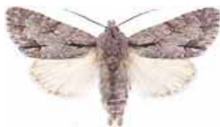
Acronicta tridens Treuddtecknat aftonfly