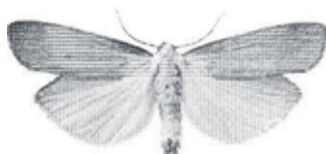
Lithosia quadra (kungslavspinnare)

2269 - Lithosia quadra : 1 ex (hane) 16/8 Trosa, 3:e fyndet inom området, trolig migrant (LJRS).