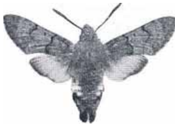
Macroglossum stellatarum (Stor dagsvärmare)

Årets mest intressanta och överraskande fynd för området var del stora antalet Stora dagsvärmare ( Macroglossum stellatarum ) som noterades, samt fynden av de migrerande arterna Förväxlat stamfly ( Hydraecia ultima ) och Kungslavspinnare ( Lithosia quadra )