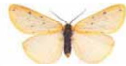
Setina irrorella Stor borstspinnare