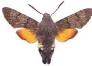
Macroglossum stellatarum Stor dagsvärmare