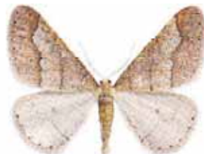
Agriopsis marginaria Grågul frostmätare