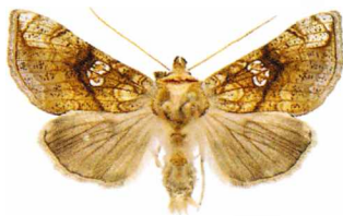
Polychrysis moneta Guldgult metallfly

2341 - Earias chlorana : 2 ex 10/7 Erikslund (LJRS).