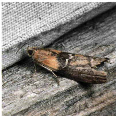
Sciota adalphella Vitpilmott

1714 - Erynnis tages : 6 ex 19/6 Erikslund (LJRS)