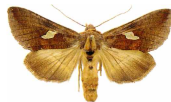
Autographa bractea Platinatecknat metallfly

2352 - Macdunnoughia confusa : 1 ex 23/8 Trosa (LJRS). Trolig migrant.