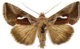
Macdunnoughia confusa Dropptecknat metallfly