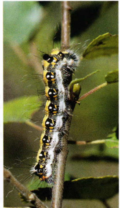
Acronicta tridens Treuddtecknat aftonfly

2054 - Eupithecia virgaureata : Larver som hittades på gullris 30/8 2009 Gravtorp Vagnhärad. Larverna förpuppade sig i september och oktober. Pupporna kläcktes bra, samtliga ex som förvarats utomhus kläcktes under en kort period 18/5 – 20/5 2010. (LJRS). Ny art för området