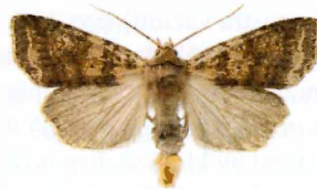
Diarsia dahlia Dahls jordfly