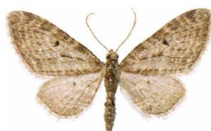
Eupithecia virgaureata Gullrismalmätare

Under 2010 har endast en permanent ljusfälla varit igång i området, men under delar av semesterssäsongen (mitten juli - augusti) så var ingen fälla tänd. Två nya arter för området har noterats den ena kläcktes från larver om hittades redan 2009 Eupithecia virgaureata (Gullrismalmätare) och den andra det intressanta mottet Sciota adalphella (Vitpilmott) som lever på asp.