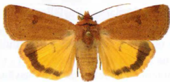
Noctua comes Leverbrunt bandfly

2693 - Xestia c-nigrum : 1 ex 31/8 Trosa (LJRS).