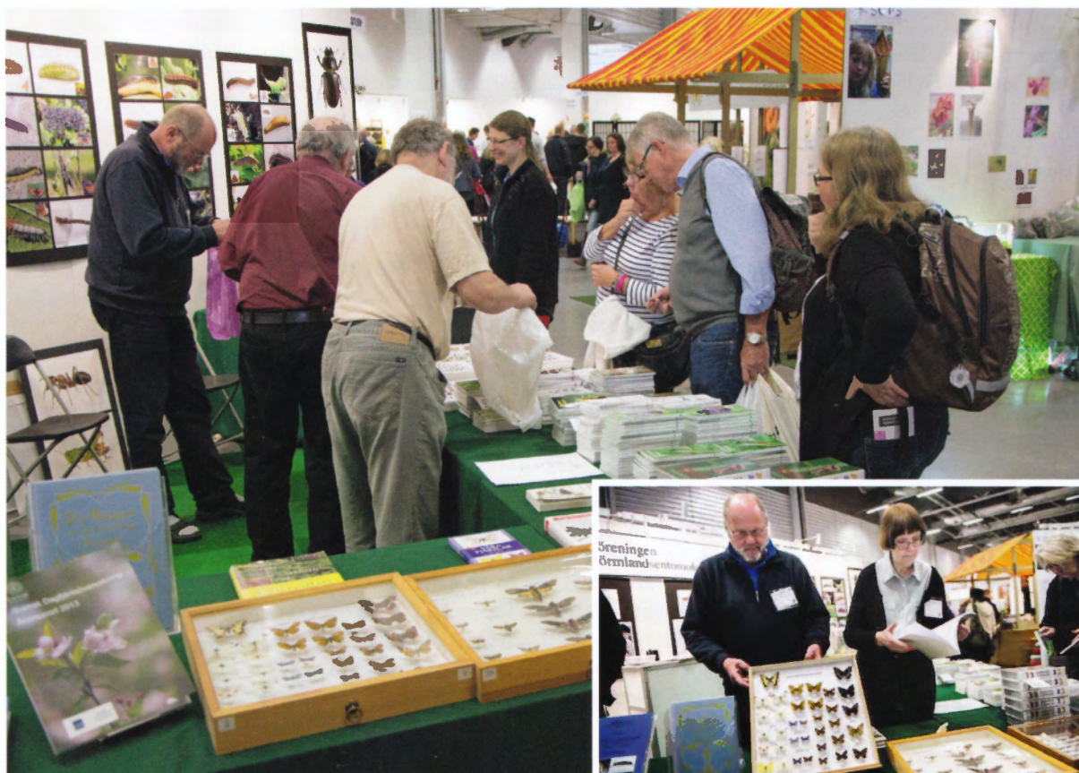
Full fart på rådgivning och försäljning. Årets tema var "Larver".