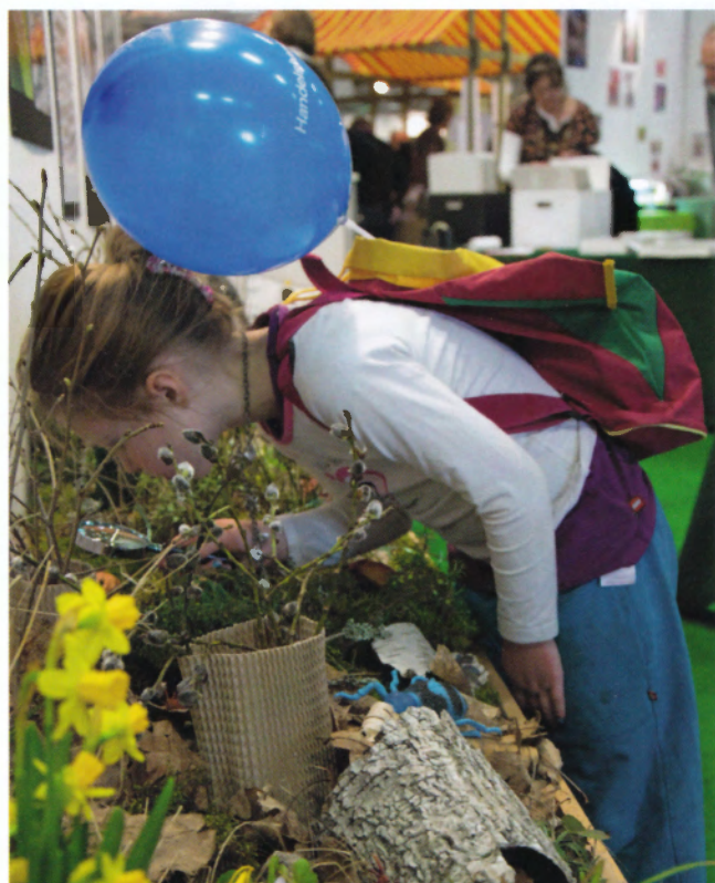
Det populära "barnbordet" lockade många besökare.