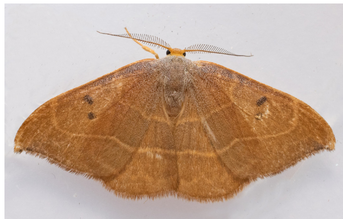
Text och bild Staffan Kihl